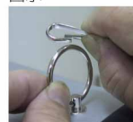
掛鍊勾住機身兩側的掛環