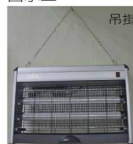
掛至牆壁上的掛勾 (※高度限180公分以上)