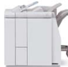
骑马订装订器 带选配的 C-Z型折页器