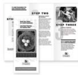
对折页, C型或Z型三折页