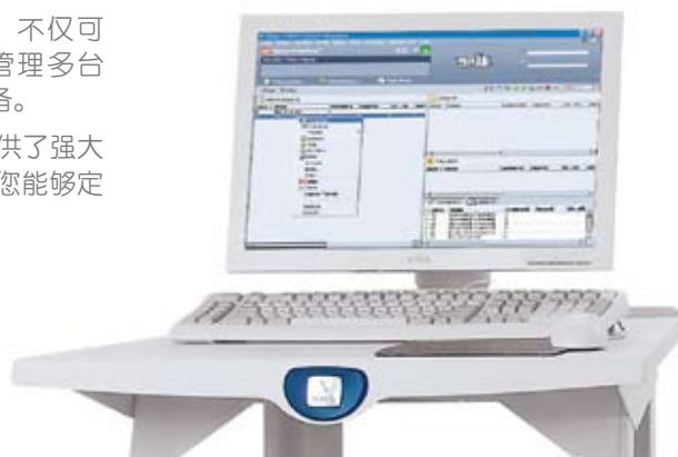
FreeFlow Print Server