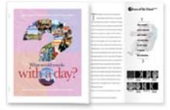
工程图式Z型三折页

Fuji Xerox 4112™/4127™ 不仅仅是一台数码多功能机。它更带给你强大的能力, 为客户制作他们需要的各种应用。将来, 你还可以用它来开发各种富有创意的新业务。这里例举一些利用这台打印机可以轻松开发的应用和服务的行业。