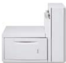
A3大容量进纸盒 (2,000张纸, 最大尺寸为SRA3)