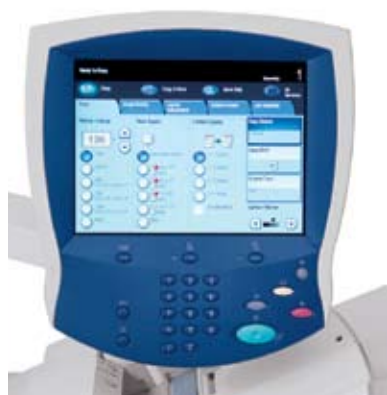
集成式复印/打印服务器