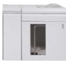
接口模块和大容量 堆纸器(5,000张 纸的容量)