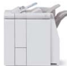
标准装订器, 带选配的 C-Z型折页器