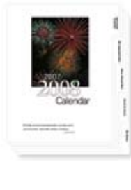
带耳纸和彩色插页