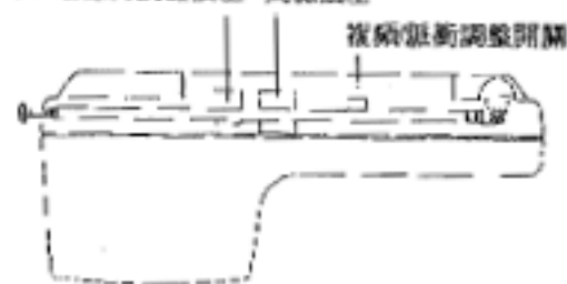
DC9V 電源轉換器插座 局接插座