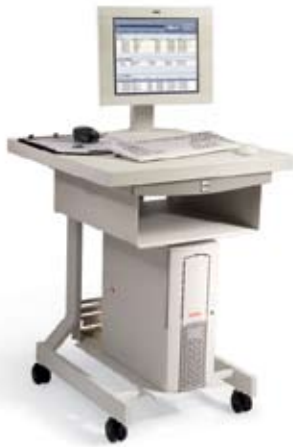
FreeFlow®打印服务器 (支架是选配件)

DocuColor 5000AP配合下面的三种功能强大的打印服务器之一——FreeFlow打印服务器，Creo®或EFI®——提供了优异的性能和生产力，组成满足客户业务需要的解决方案。选择哪个服务器要根据用户的工作流程和应用来决定。虽然打印服务器的功能可能有较大的差别，但它们一些重要的功能和价值是相同的。每个服务器都采用业界标准的硬件和软件，与您的现有流程相结合，支持可变数据打印(VI)，助您开拓新的应用。每个服务器都支持PDF和PostScript文件打印。他们都能接收打印通用软件，如QuarkXPress®, Adobe® Creative Suite, Microsoft® Word, 和 Microsoft Publisher等，生成的文件，也支持VI打印、作业管理和作业工单功能。