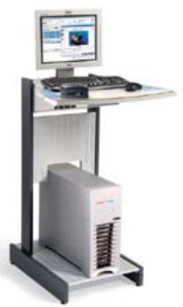
Creo Spire®彩色服务器 (支架是选配件)